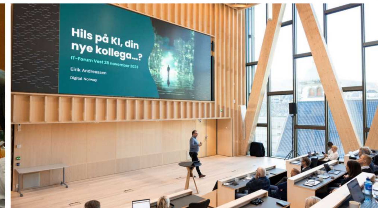
Glimt fra IT-konferansen 2023.